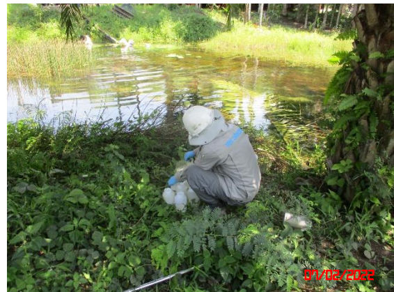
คลองสุญ (หลังจากห้วยด้วนบรรจบกับคลองสุญ)