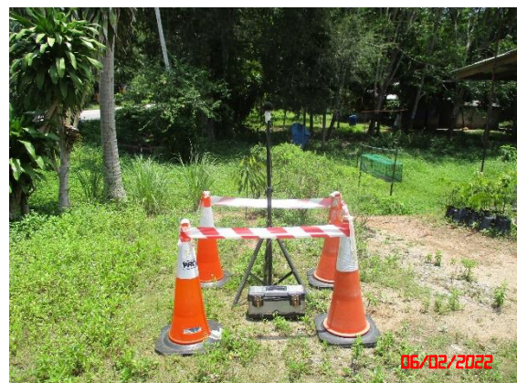
บ้านช่องช้าง