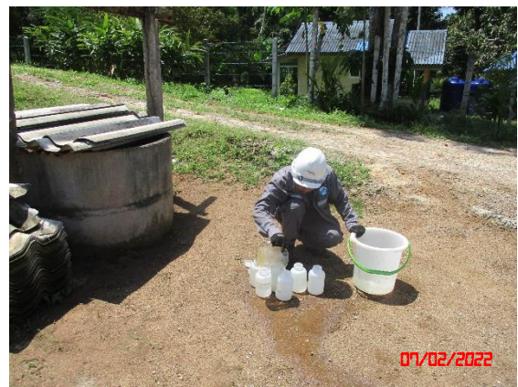
น้ำบ่อต้นบ้านห้วยล่ง