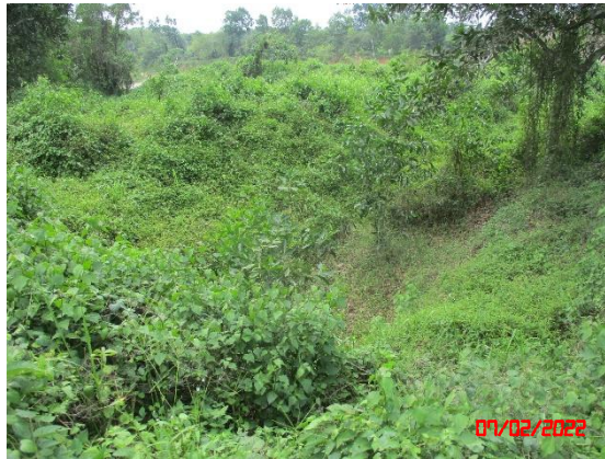
ห้วยด้วน (หลังผ่านพื้นที่โครงการ)