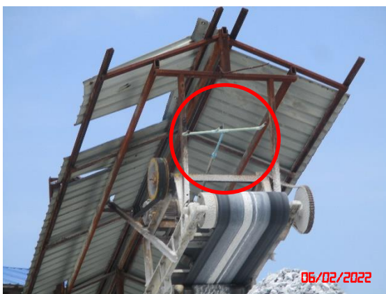
ระบบสเปรย์น้ำบริเวณปลายสายพานลำเลียง