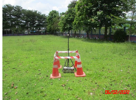
บ้านมหาราช