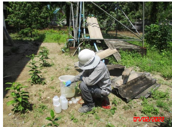
น้ำบ่อต้นบ้านหูนบ