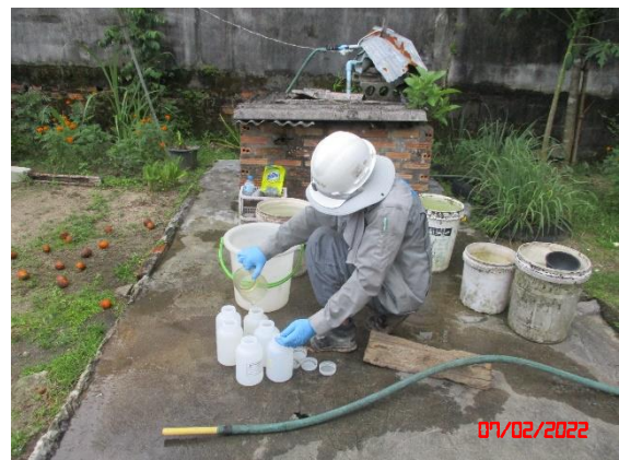
น้ำบ่อต้นบ้านมหาราช