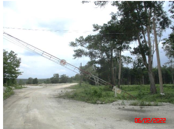
บริเวณภายในพื้นที่โครงการ