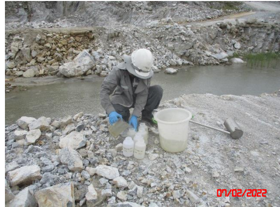
ชุมเหือง