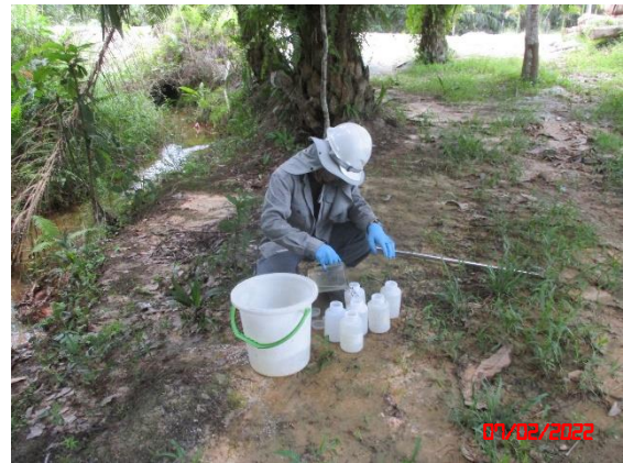
คลองสุญ (ก่อนบรรจบกับห้วยด้วน)