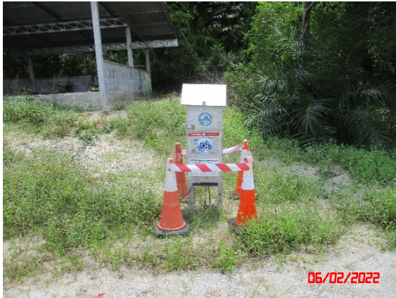
บ้านห้วยล่ง