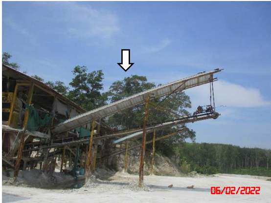
หลังคาปิดคลุมสายพานลำเลียง