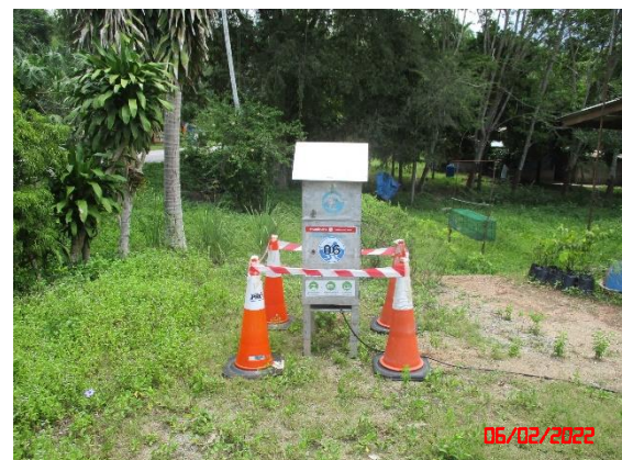
บ้านช่องช้าง