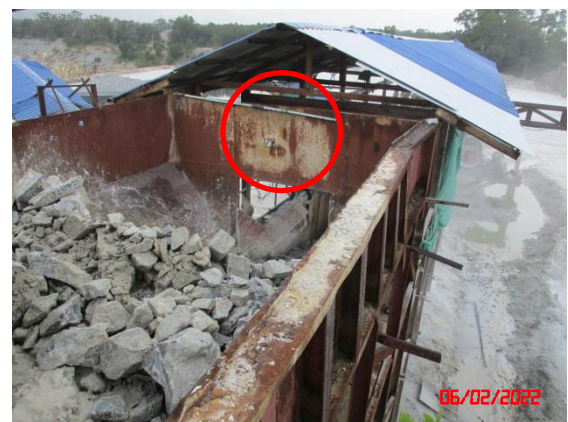
ระบบสเปรย์น้ำบริเวณยั้งรับหิน