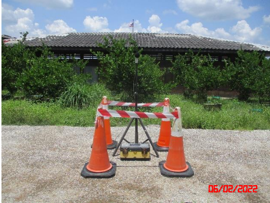
บ้านห้วยลวง