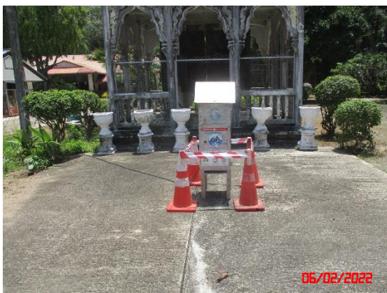
บ้านห้วยสะตอ