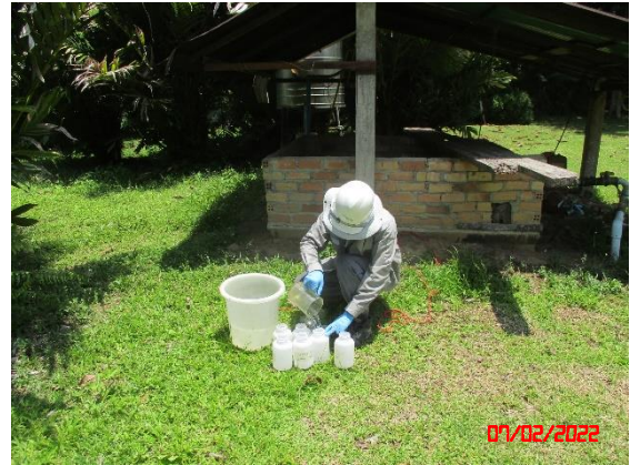
น้ำบ่อต้นบ้านห้วยสะตอ