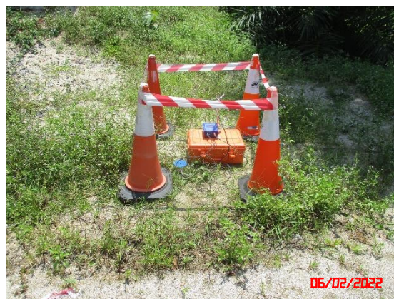
ชุมชนบ้านห้วยลวง