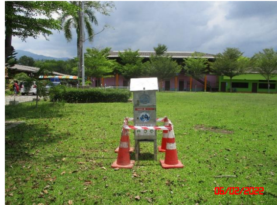
บ้านมหาราช