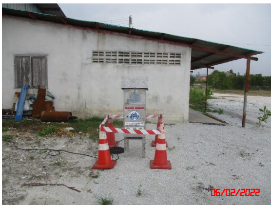
สำนักงานโรงเต่างแร่