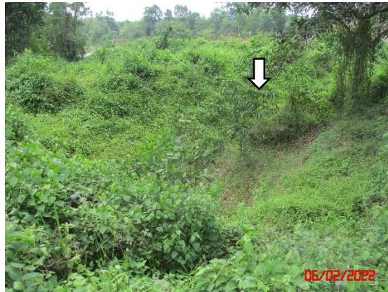
รูปที่ 2-4 แนวต้นไม้โดยรอบพื้นที่โครงการ