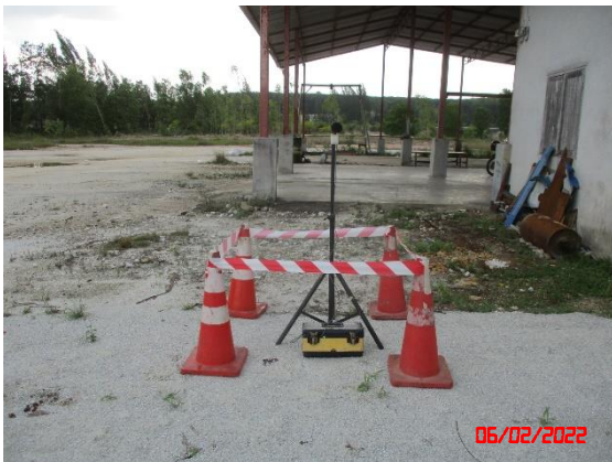
สำนักงานโรงเต่างแร่