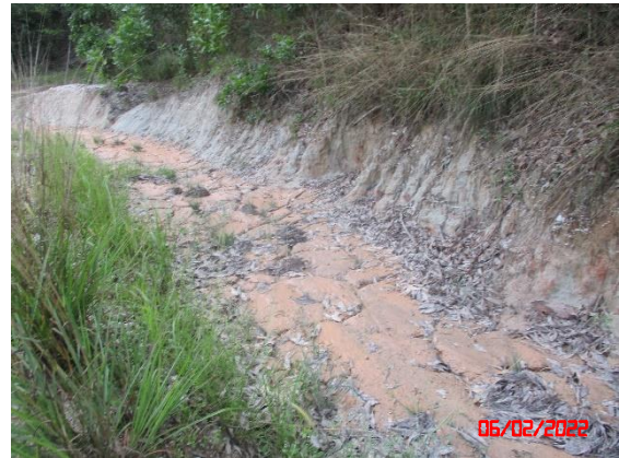
รูปที่ 2-7 บ่อดักตะกอน