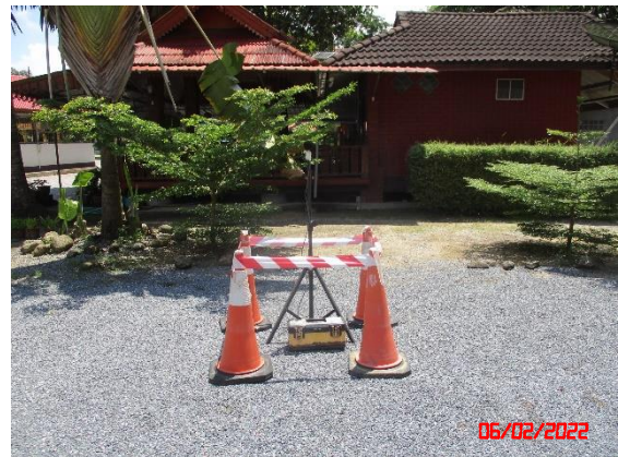
บ้านหุนบ