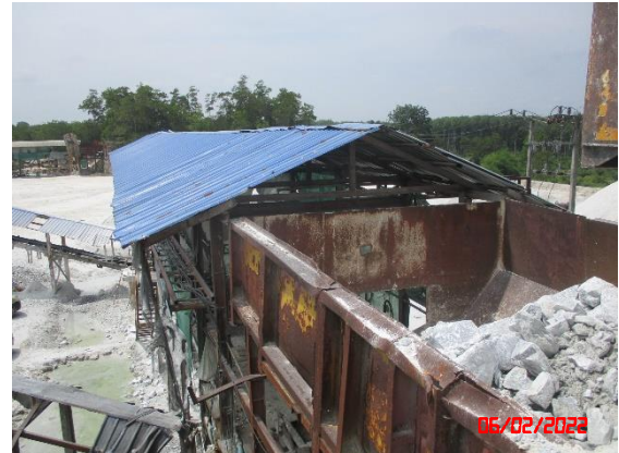
ยั้งรับหิน