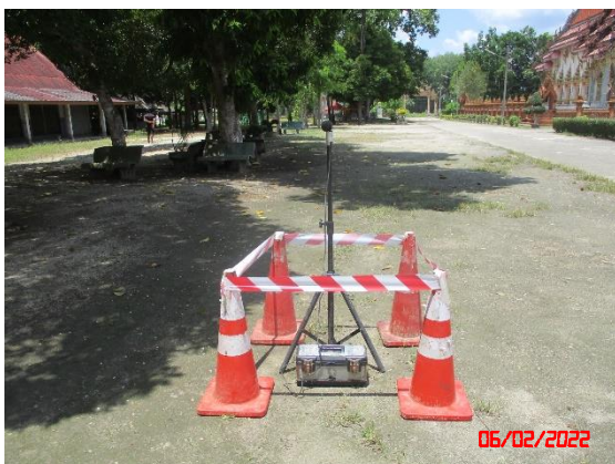
บ้านห้วยสะอาด