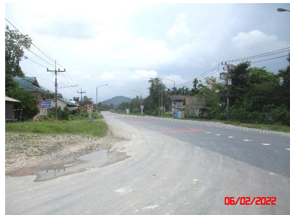
บริเวณเส้นทางสาธารณะภายนอกโครงการ