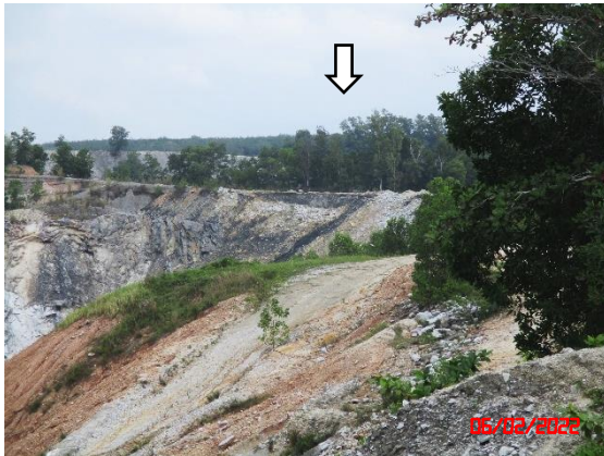
รูปที่ 2-1 แนวต้นไม้บริเวณพื้นที่เวนคืนการทำเหมือง