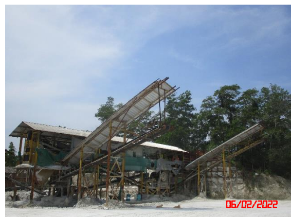
อาคารปิดคลุมโรงแต่งแร่