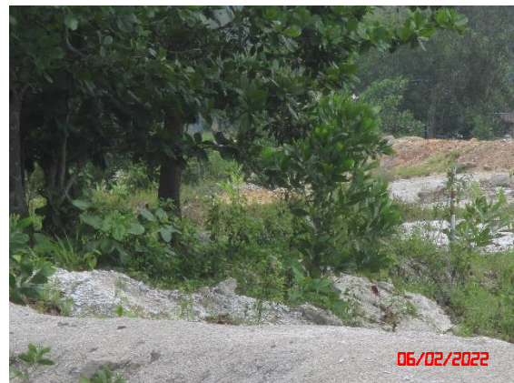
รูปที่ 2-2 เส้นทางสาธารณะบริเวณขอบประทานบัตร